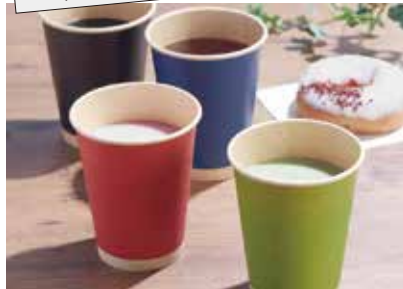
エコフレンドリーで機能的なドリンク用品が大集合! カラーペーパーカップ

両面PEコーティング加工で結露に強く、ホットはもちろん、コールドやデザートドリンクにもおススメです。