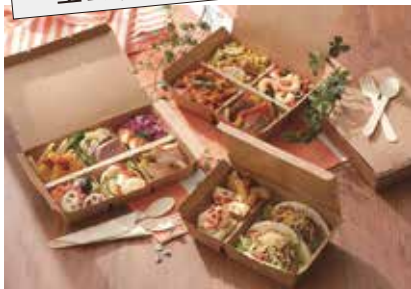
森林認証紙使用の紙製ランチボックス エコランチボックス

紙素材のランチ容器は軽く、使用後はそのまま捨てられるので便利!!新たに白無地が新登場!