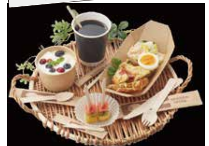
使い捨てカトラリーの脱プラ化で人気!! 木製カトラリーシリーズ

天然の木材製で燃えるゴミとして廃棄できる、エコロジー商品です。脱プラ化の加速で人気!