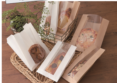
中身が見えてディスプレイにもオススメ! 窓付耐油ガゼットパック

紙素材のランチ容器は軽く、使用後はそのまま捨てられるので便利!! 環境を考えたエコ製品です。