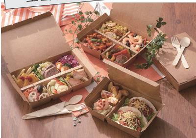
森林認証紙使用の紙製ランチボックス エコランチボックス

紙素材のランチ容器は軽く、使用後はそのまま捨てられるので便利!! 環境を考えたエコ製品です。