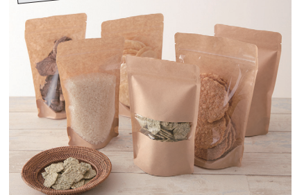
内容物を保護し、品質の劣化を防ぎます クラフトチャック付スタンド

何度も繰り返し開閉出来る便利なチャック付きの袋です。自然な風合いのクラフト紙を使用しています。