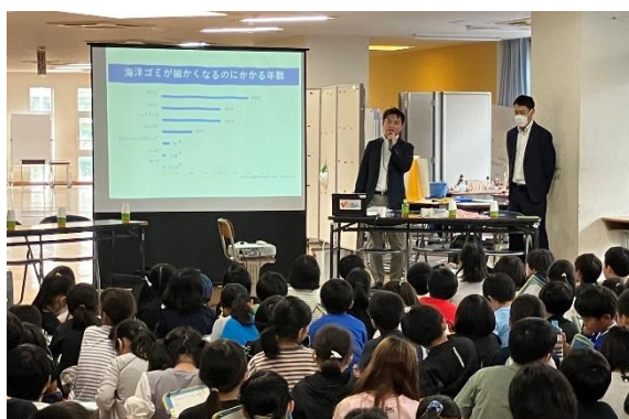
※埼玉県内の小学校での出張授業の様子