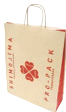
自社再生紙を用いた直営店用の紙袋