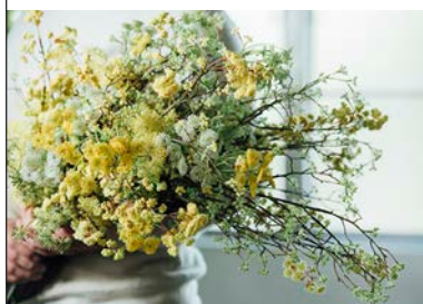
SILKKA flowers for life

シモジマ循環型リサイクルシステムで生まれ た古紙配合率 100%の自社再生紙を使用