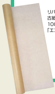
リバーシブルの古紙配合率100%の再生紙「エコデュオ」