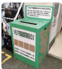
使用済み紙袋の回収箱

紙袋「回収」のステップが、新たに加わったことにより、4R=リユース・リデュース・リサイクル+リメンバーからなるシモジマ循環型リサイクルシステムを構築し、環境負荷のさらなる低減を目指しています。