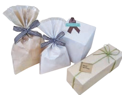
「エコデュオ」を使用したラッピング