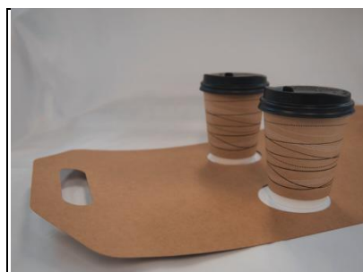
テイクアウトホルダー

平版形状で在庫は省スペース。 小規模店でも導入しやすい小ロット(販売単位25枚)になっております。