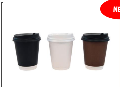
二重断熱カップ 新色(ブラック・ホワイト・ブラウン)