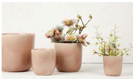
新商品 [D&M PRIME]