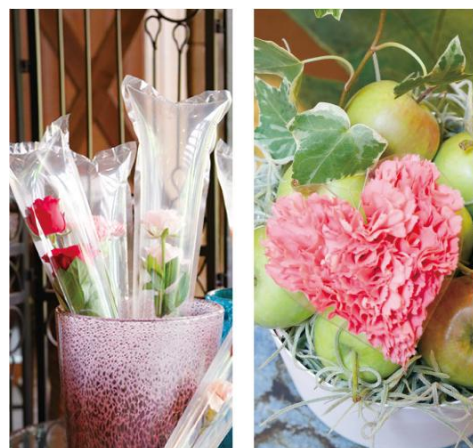
[花キャリー] [ハートホルダー]