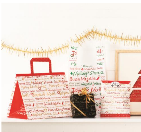
新商品 [Total Collection Letter Noel]