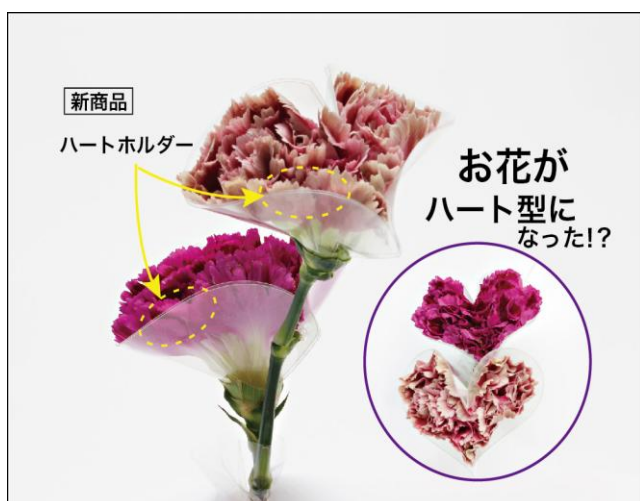
新商品 [ハートホルダー]